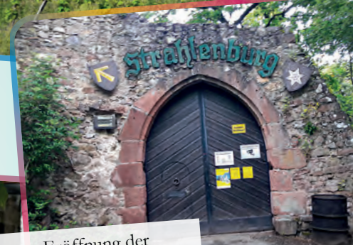
Eröffnung der Strahlenburg am 03.05.26