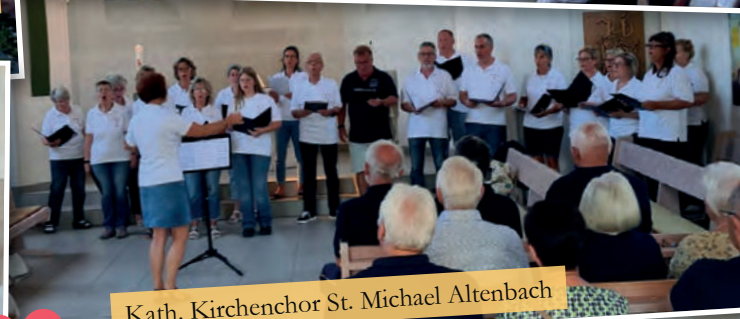
Kath. Kirchenchor St. Michael Altenbach