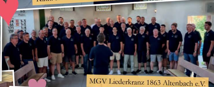
MGV Liederkranz 1863 Altenbach e.V.