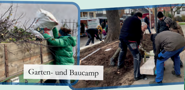
Garten- und Baucamp