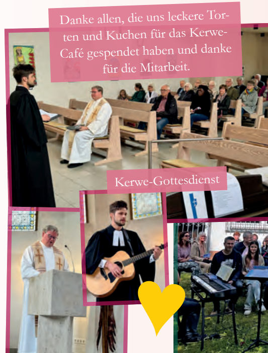
Danke allen, die uns leckere Torten und Kuchen für das Kerwe-Café gespendet haben und danke für die Mitarbeit.