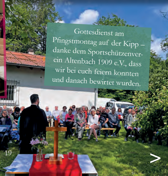
Gottesdienst am Pfingstmontag auf der Kipp – danke dem Sportschützenverein Altenbach 1909 e.V., dass wir bei euch feiern konnten und danach bewirtet wurden.