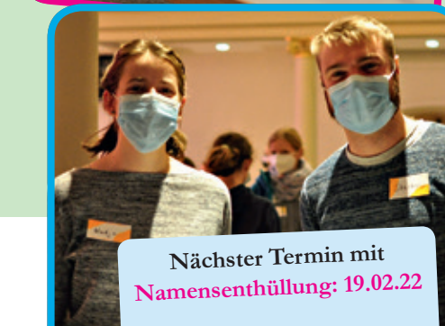
Nächster Termin mit Namensenthüllung: 19.02.22