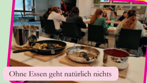
Ohne Essen geht natürlich nichts