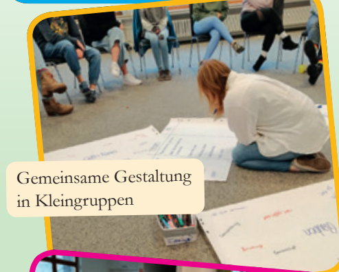
Gemeinsame Gestaltung in Kleingruppen