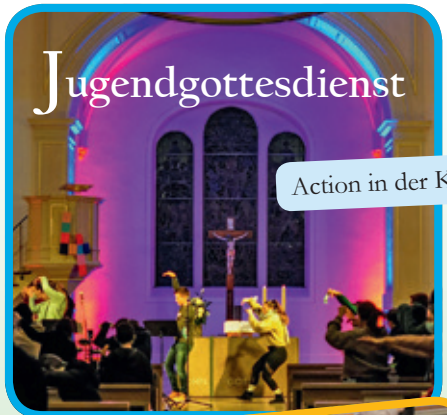
Action in der Kirche

Der Fastenkalender ist im „mittendrin“ erhältlich.