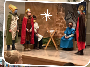
Die großen Evangeliellen beim Weihnachtsmusical