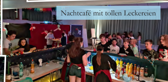
Nachcafé mit tollen Leckereien