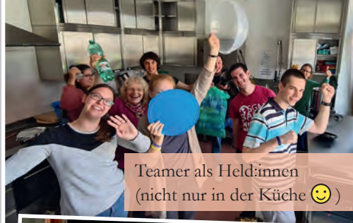
Teamer als Held:innen (nicht nur in der Küche 😊)

Hier einige Impressionen. Ohne fantastische Teamer wäre das nicht möglich gewesen.