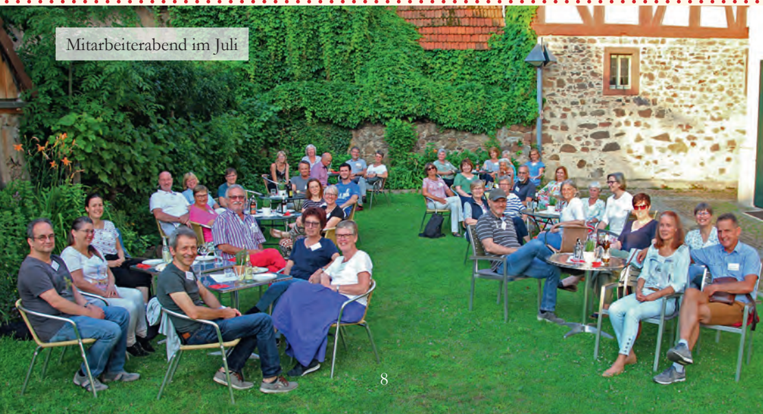
Mitarbeiterabend im Juli