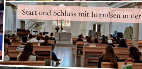
Start und Schluss mit Impulsen in der Kirche