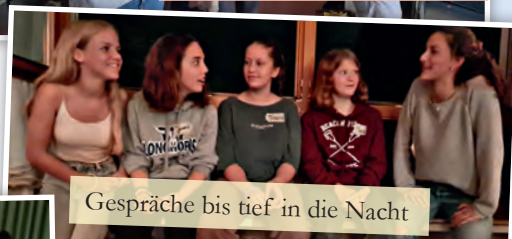
Gespräche bis tief in die Nacht