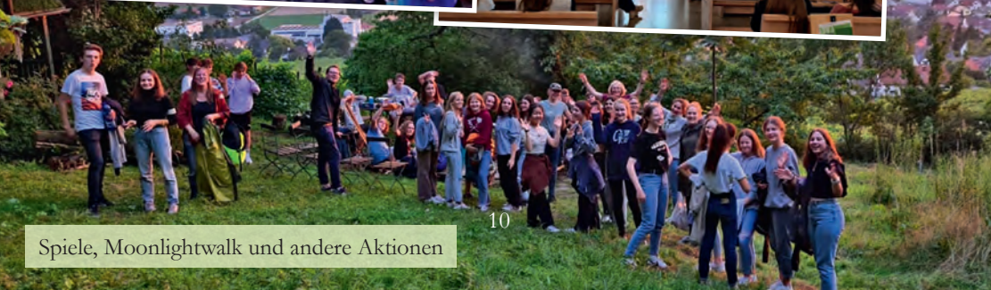
Spiele, Moonlightwalk und andere Aktionen