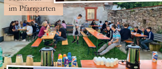
Stockbrot und Lagerfeuer